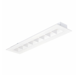
Corp de iluminat încastrat PowerBalance gen2 RC360B variantă rectangulară