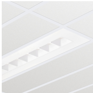
Corp de iluminat încastrat PowerBalance gen2 RC362B, variantă rectangulară