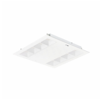
Corp de iluminat încastrat PowerBalance gen2 RC362B cu ActiLume, variantă pătrată