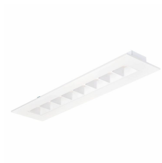
Corp de iluminat încastrat PowerBalance gen2 RC362B, variantă rectangulară