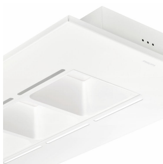
Fante manevrare aer