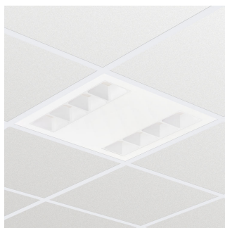
Corp de iluminat încastrat PowerBalance gen2 RC362B, variantă pătrată