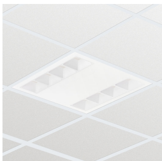
Corp de iluminat încastrat PowerBalance gen2 RC360B, variantă pătrată