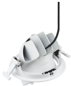
RS782B LuxSpace Accent Performance Elbow Back View