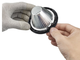
Step3: Pull the clip of the frontface to release the reflector