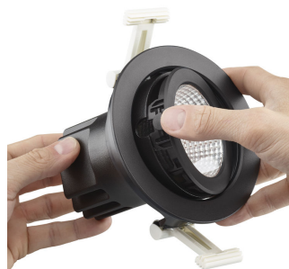
Step1: Press the button to unlock the front face