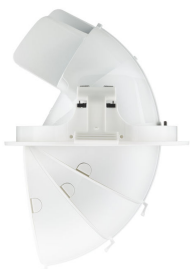
LuxSpace Accent Elbow luminaires offer great aiming flexibility