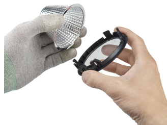
Step4: Replace the reflector