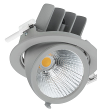
RS782B LuxSpace Accent Performance Elbow Silver