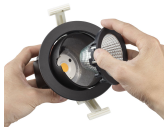
Step2: Remove the optical assembly from the luminaire