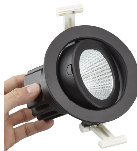
PerfectAccent reflector and front glass maintenance and upgrading is easy with an integrated button