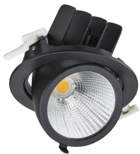
RS782B LuxSpace Accent Performance Elbow Black