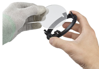
Step5 (optional): Add or remove the front glass