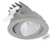
RS771B LuxSpace Accent Compact Adjustable Silver