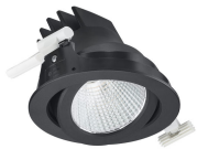
RS771B LuxSpace Accent Compact Adjustable Black