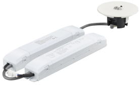
Emergency downlight EM120B