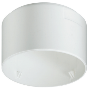
LRH2070/00 SURFACE BOX