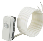
LRM8119/00 Lum Based Ext Sensor with LCA8004/00 COVER