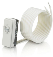
LRM8119/00 Lum Based Ext Sensor with LCA8004/00 COVER