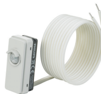
LRM8119/00 Lum Based Ext Sensor with LCA8004/00 COVER