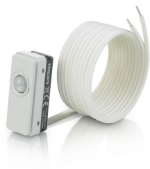
LRM8119/00 Lum Based Ext Sensor with LCA8004/00 COVER